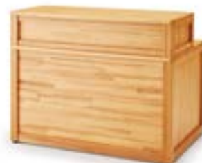
受付型カウンター