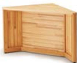
コーナーカウンター