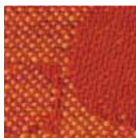
オレンジレッド 管理番号S0055