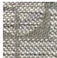
ライトグレー 管理番号S0050