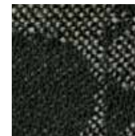
ブラック 管理番号S0048