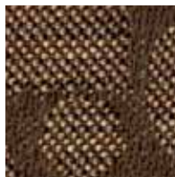
ダークブラウン 管理番号S0051