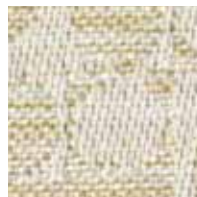
ベージュ 管理番号S0052