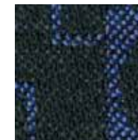
ナイトブルー 管理番号S0053