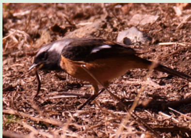
ウッドチップの隙間をつつくジョウビタキ