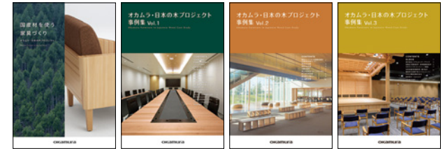
『国産材を使う家具づくり』 『オカムラ・日本の木プロジェクト事例集 vol.1-3』

オカムラでは、国産材利活用のポリシーや積み重ねてきた研究、木に関する知識などを分かりやすくまとめたカタログ「国産材を使う家具づくり」と「オカムラ・日本の木プロジェクト事例集 vol.1-3」を発行しており、今後も継続的に内容の刷新、事例集を発行していきます。お客さまの国産材利活用検討の参考となる情報提供だけでなく、社内のさまざまな部門の従業員が理解を深めることにもつながっています。