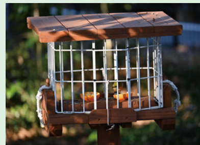
蛍光灯カバーをリサイクルして作った餌台