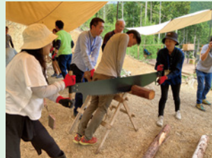
両挽鋸で丸太と格闘！

今後も、家具メーカーで働く立場で、自らが社会課題の解決に貢献できるアクションを考える機会を設けていきます。