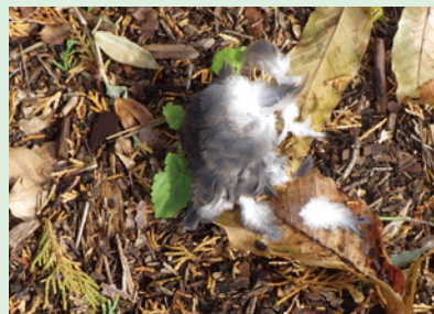
猛禽類が採食した痕跡の羽根