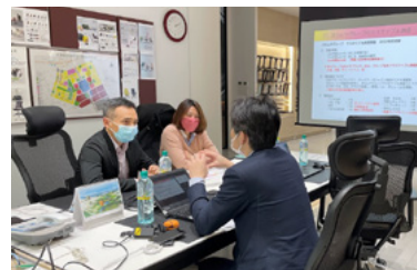
お取引先実地監査の様子

今後も取引の状況や調査の結果、環境・社会的インパクトの大きさ等を勘案しながら、適宜実地監査を行い、お取引先の取り組みを促していきます。（データ集 ▶ P.160 ）