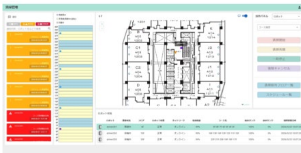
【ロボットマネジメントシステム画面】