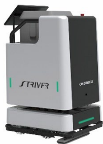
【掃除ロボット STRIVER II】