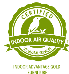
Indoor Advantage 認証試験

Indoor Advantage 認証は、揮発性有機化合物 (VOC) の厳格な室内空気質 (IAQ) 化学物質排出制限を満たすことにより、家具製品が健康的な室内環境をサポートすることを保証します。認証を受けるには、製品が VOC 排出基準 (ANSI/BIFMA X7.1) に準拠しているかどうか、第三者試験機関で試験を受け、懸念される VOC 排出量を確認する必要があります。