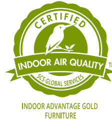
Indoor Advantage 認証試験

シックハウス症候群やアレルギー性皮膚炎の原因とされるホルムアルデヒド、トルエン、キシレンなどの揮発性有機化合物の削減を進めています。快適さと強度を追求しながら、同時に環境負荷の低減を実現しました。