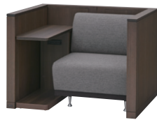
(ユニットソファ×ブースタイプ)