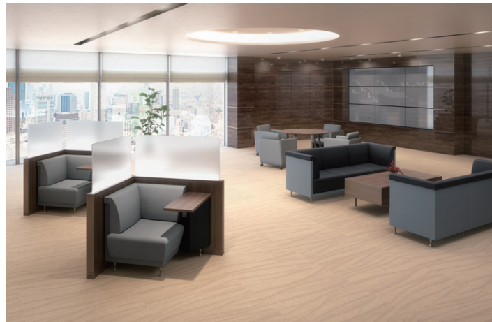
Financial store lounge