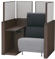
(背メッシュソファ×ブースタイプ)