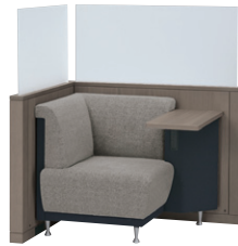
(タブレット付ソファ×ブースタイプ)