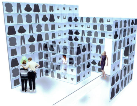
展示とファッションショー