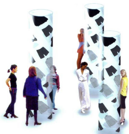
展示とショー空間