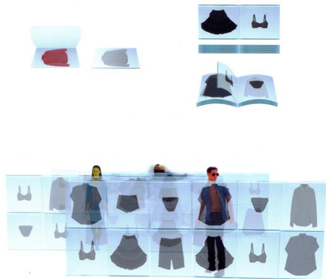
多層に透けて見える商品と洋服合わせ

既存の展示空間では金具、吊り糸などの什器が商品以外にどうしても目立ってしまっている。什器が什器でないような、什器が存在を消して商品だけに目がいくような、什器自体が空間を作っているような、そんな什器を提案する。そこでは、商品が宝石のように展示され、時には自分の姿と商品を照らし合わせる合わせ鏡として利用されたりと、用途によって姿を変えていく。