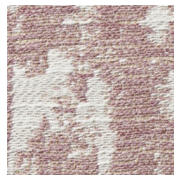
Pink Opal 管理番号S0187