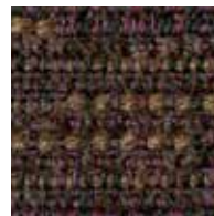
パープルブラウン 管理番号S0047