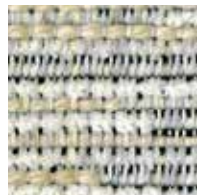
アイボリー 管理番号S0044