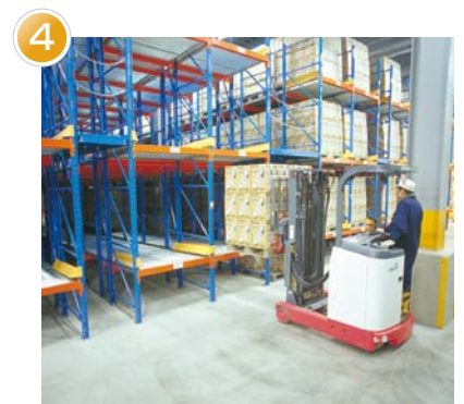
フォークリフトで入庫