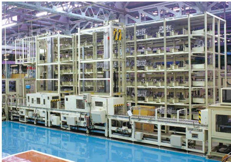
多段式独立水平回転棚

多段式独立水平回転棚（ロータリーラックH）の導入により、さまざまな車種のシリンダーブロックを完成した順に一時保管し、車種ごとにまとめてタイミングよく次工程へ出荷しています。シリンダーブロックの形状に合わせたトレイの設計で製品を傷つけることなく格納しています。