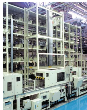
自動昇降入庫装置 (オートリトリーバー)