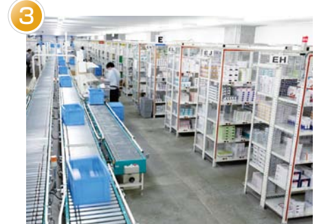
ピース品ピッキングエリア