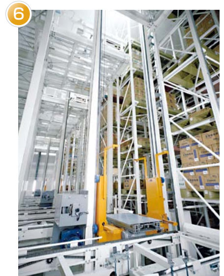
パレット自動倉庫