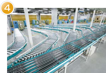
方面別仕分けエリア