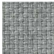
ライトグレー / FS09 管理番号SFS09