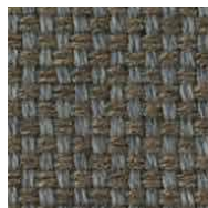
グレーブラウン / FS10 管理番号SFS10