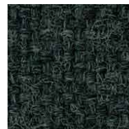
ダークグレー / FHP4 管理番号SFHP4