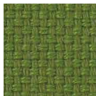
イエローグリーン / FHN3 管理番号SFHN3