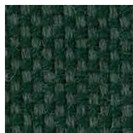
ディープグリーン / 116 管理番号S0086