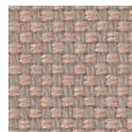
パールピンク / FFX8 管理番号SFFX8