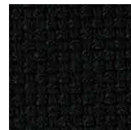
ブラック / FHP2 管理番号SFHP2