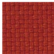
オレンジレッド / FHN8 管理番号SFHN8