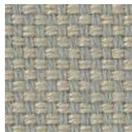
ベージュ / FS32 管理番号SFS32