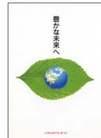
環境パンフレット「豊かな未来へ」