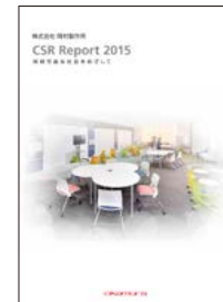
[CSR Report 2015]