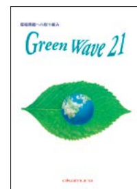
「GREEN WAVE 21」