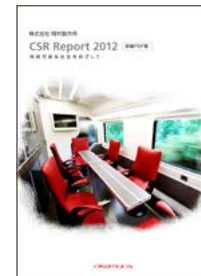
[CSR Report 2012]